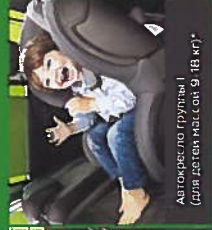
Автокресло группы I (для детей массой < 18 кг)