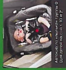
Автокресло «Ильичка» - Группа 0 (для детей массой < 10 кг)