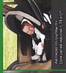
Автокресло группы 0+ (для детей массой < 13 кг)