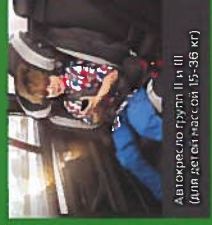
Автокресло группы II и III (для детей массой < 36 кг)